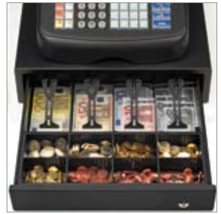
STOR KOMPAKT PENGESKUFFE og ekstra skuffe til små artikler