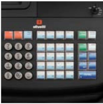
FARVE OPDELT FUNKTIONSTASTER og direkte adgang til 40 varegrupper